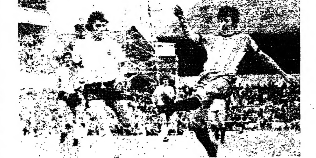
كوزموس يركض لطلب الكرة في مباراة مع روما

كوزموس يركض لطلب الكرة في مباراة مع روما في بطولة الاوروبية لكافة الفرق التي انطلقت في روما. في مباراة امس بين روما وكوزموس، خسر كوزموس 1-2. وكان كوزموس قد سجل في الدقيقة 15، بينما سجل روما في الدقيقتين 25 و35. في مباراة امس بين روما وكوزموس، خسر كوزموس 1-2. وكان كوزموس قد سجل في الدقيقة 15، بينما سجل روما في الدقيقتين 25 و35.